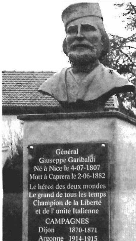
Garibaldi a enfin sa stèle.

Combien ont été emprisonnés et torturés par les bandes des chemises noires durant la triste époque Mussolinienne pour n'avoir pas accepté la déchéance de l'Être Humain