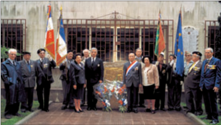
►► Excombatientes ► Españoles que lucharon por Francia, en un acto en Madrid, en mayo pasado.