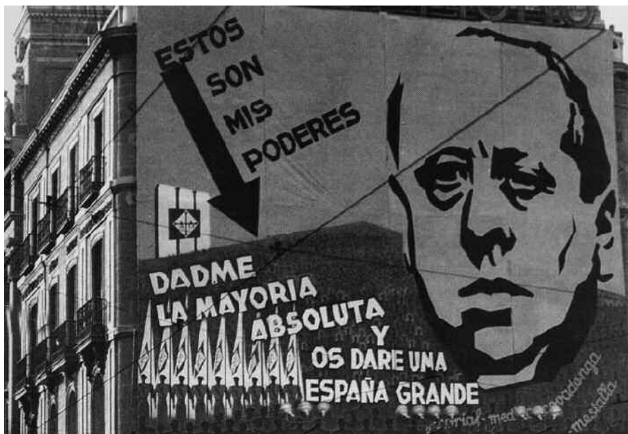
16 de febrero de 1936: propaganda de la CEDA de Gil Robles en la Puerta del Sol de Madrid para las elecciones generales.

En contra de lo repetido y reiterado hasta la saciedad, el golpe no fue inevitable. Hubiera bastado que las elecciones en las que triunfó el Frente Popular las ganasen las derechas para desactivar las actividades conspirativas en el Ejército y entre los requetés.