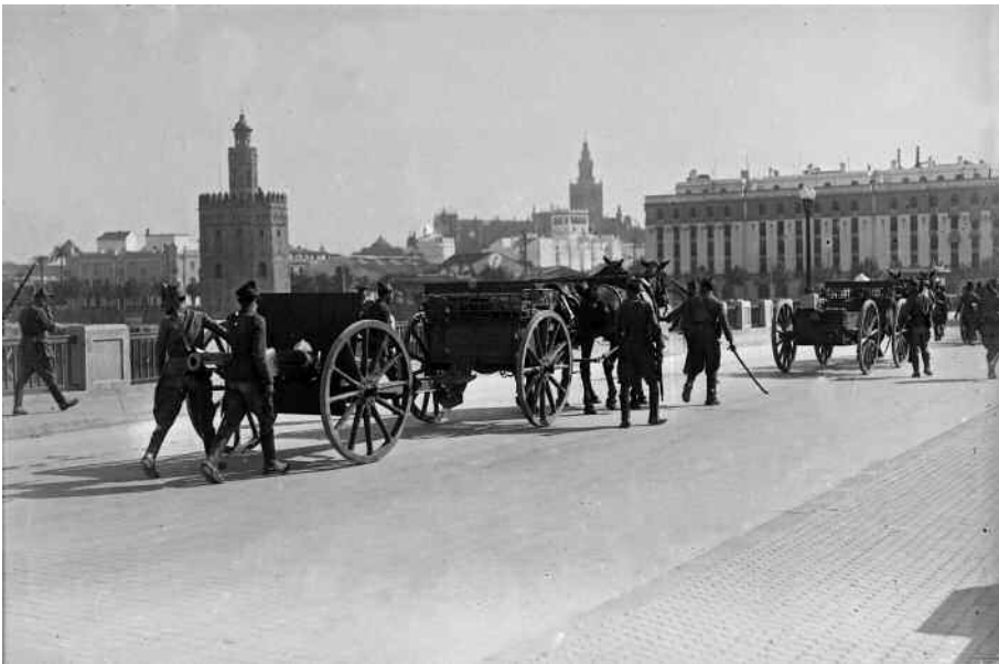
21-22 de julio de 1936: tropas golpistas cruzan el puente de San Telmo tras la toma del barrio de Triana.

Llegar a profundizar en todo esto y poder establecer el proceso, los grados de responsabilidad en la represión y sus consecuencias ha sido posible gracias a la apertura a la investigación en 1997 de los fondos de la Auditoría de Guerra de la II División, sin los cuales seguiríamos como antes. Legalmente debieron abrirse once años antes pero no fue así. Las consecuencias ya las sabemos: ninguno de los trabajos provinciales realizados antes de esa fecha (Córdoba, Málaga, Jaén, Huelva y Sevilla) pudo utilizar esos fondos.