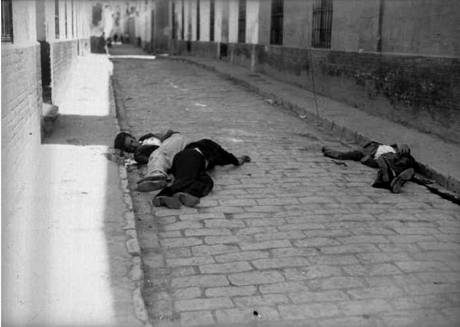
21 de julio de 1936: cadáveres en una calle de Triana tras la violenta toma del barrio por las fuerzas del comandante Castejón.

Alguien de los propios mandos militares tuvo que prohibir expresamente la inscripción de las muertes en el registro civil, dejando patente desde un primer momento el interés en ocultar la represión. Y de la misma forma, se decidió no practicar a nadie la autopsia de su muerte, echar los cadáveres en la fosa común del cementerio y, por supuesto, no llevar a cabo ningún registro nominal en el correspondiente libro de enterramiento. Se procuró que legal y documentalmente no quedasen pruebas de la matanza.