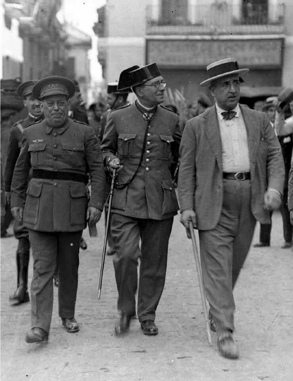
10 de agosto de 1932: protagonistas del intento de golpe de estado conocido como la Sanjurjada . De izquierda a derecha, el general José Sanjurjo, el teniente coronel de la Guardia Civil Barea y el general García de la Herranz caminan por la calle Jesús del Gran Poder de Sevilla en dirección al centro de la ciudad (detalle).