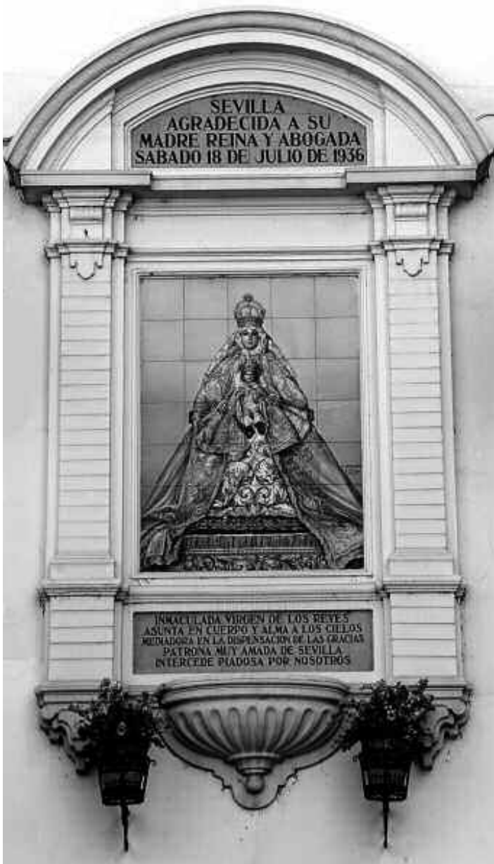
Retablo de la Virgen de los Reyes, fachada del Convento de la Encarnación, Plaza Virgen de los Reyes, Sevilla. El azulejo data de 1928, firmado por Antonio Kiernam en la Fábrica Santa Ana. Posteriormente, a principios de 1940, se añaden las leyendas superior e inferior junto con el marco arquitectónico.