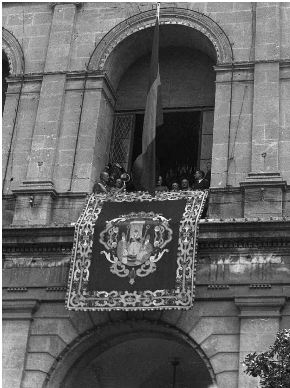
15 de agosto de 1936: Queipo de Llano procede a la sustitución de la bandera republicana por la roja y gualda en el Ayuntamiento de Sevilla. Franco asiste al acto (detalle).