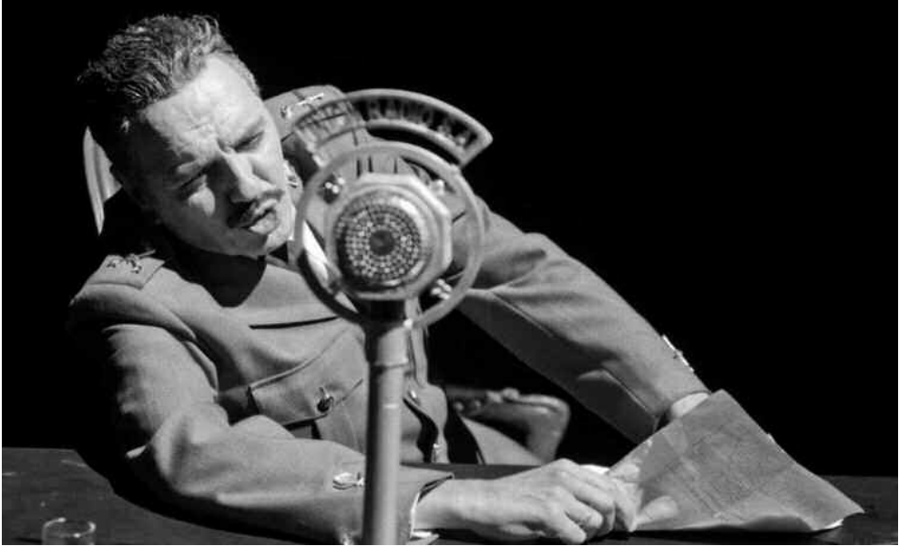
Las charlas de Queipo de Llano desde los micrófonos de Unión Radio Sevilla. Dibujo de Jorge Castañeda Curado sobre una escena de la obra de teatro Queipo, el sueño de un general , de Pedro Álvarez-Ossorio.

alrededor de 800 los periodistas que conocen la cárcel o algún otro tipo de represión, incluida la imposibilidad de seguir ejerciendo la profesión, y a todas ellas hay que añadir los que, sin conocer prisión, pierden también la posibilidad de trabajar en medios. De los casi 300 diarios que se imprimen en España en vísperas del golpe, no llegan a un tercio los que siguen en publicación cuando la guerra civil concluye.