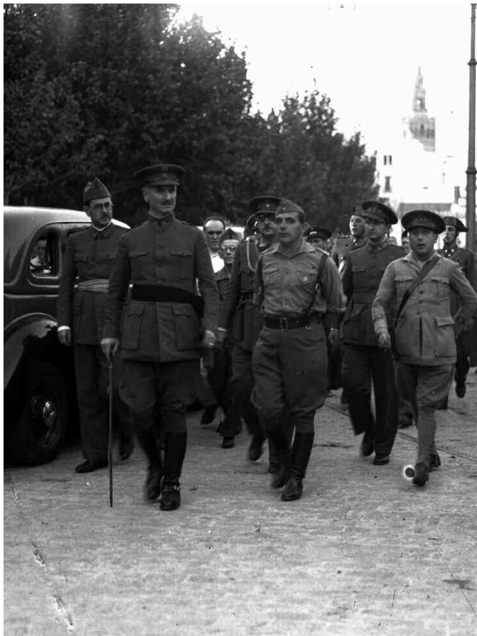
2 de agosto de 1936: Queipo de Llano durante el homenaje realizado en Sevilla al comandante Castejón. Le acompañan José Cuesta Monereo, jefe del Estado Mayor, y el capitán Manuel Díaz Criado (detalle).