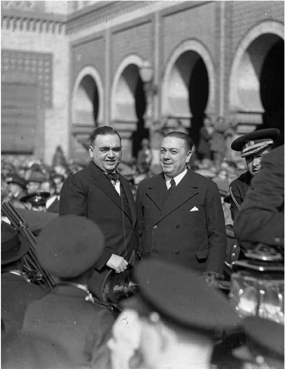
21 de abril de 1936: Horacio Hermoso Araujo, alcalde de Sevilla, con Diego Martínez Barrio, presidente interino de la República, en la estación de Plaza de Armas. El 19 de julio de 1936, como encargado de formar gobierno, intentó, sin resultado, que algunos cabecillas del golpe depusieran su actitud.