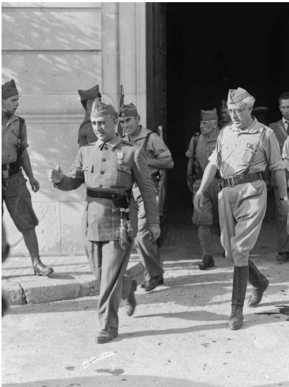
Agosto de 1936: Franco y el teniente coronel Yagüe salen del cuartel general golpista establecido en el palacio de Yanduri, en la Puerta de Jerez de Sevilla (detalle).